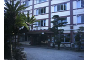
《伊勢青少年研修センター正面》

〔URL〕 http://www.syd.or.jp/ise/ 〔E-mail〕 ise@syd.or.jp